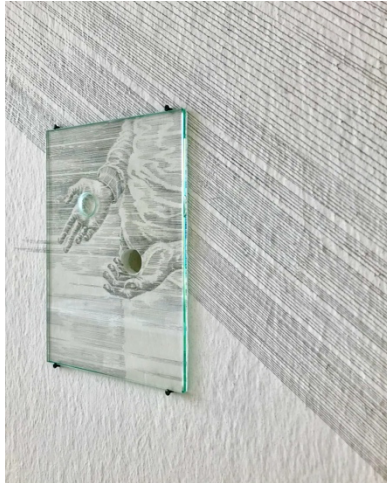
Sandra Boeschstein Ohne Titel, 2023 (Ausschnitt)

Im Jahr 2024 setzt ‚Dazwischensein‘ den gedanklichen Überbau für neun kurze, künstlerische Einzelpräsentationen, die das Thema in seinen verschiedenen Aspekten untersuchen. Dazwischensein kann ein Gedanke, Zustand oder auch ein Gefühl sein. Wir wollen Dazwischensein als Möglichkeit begreifen, mehr zu sehen und verschiedene Sichtweisen gleichzeitig in sich zu erfassen.