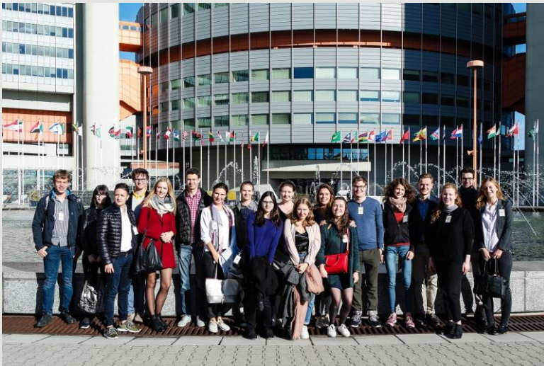
Reise des Alumnivereins nach Wien und Bratislava (2017)