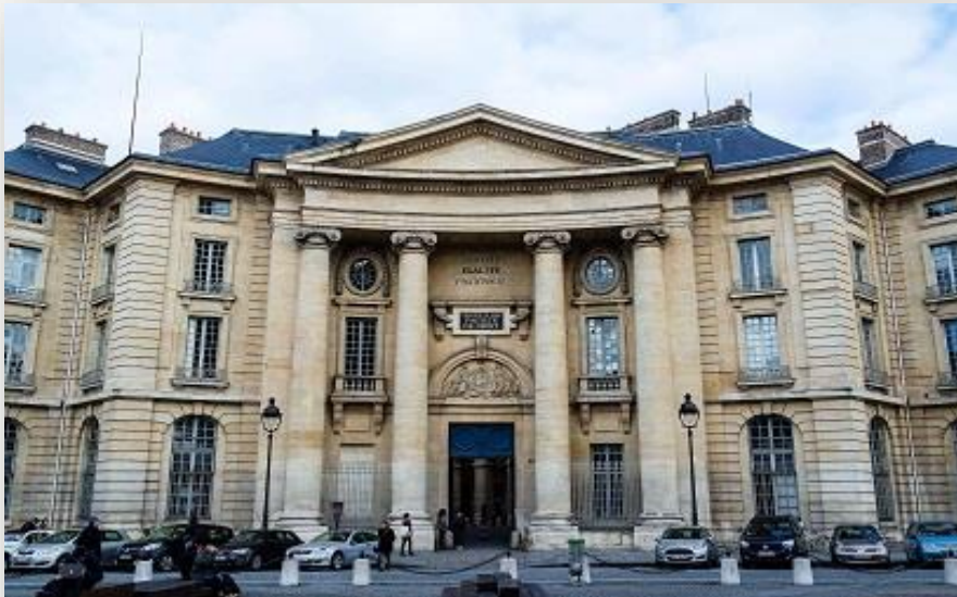
Hauptgebäude der Université Paris-Panthéon-Assas an der Place du Panthéon im 5. Arrondissement