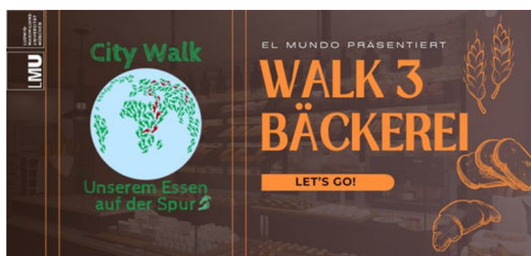
Logo City Walk 3

Sie möchten selbst die "City Walks" nutzen?