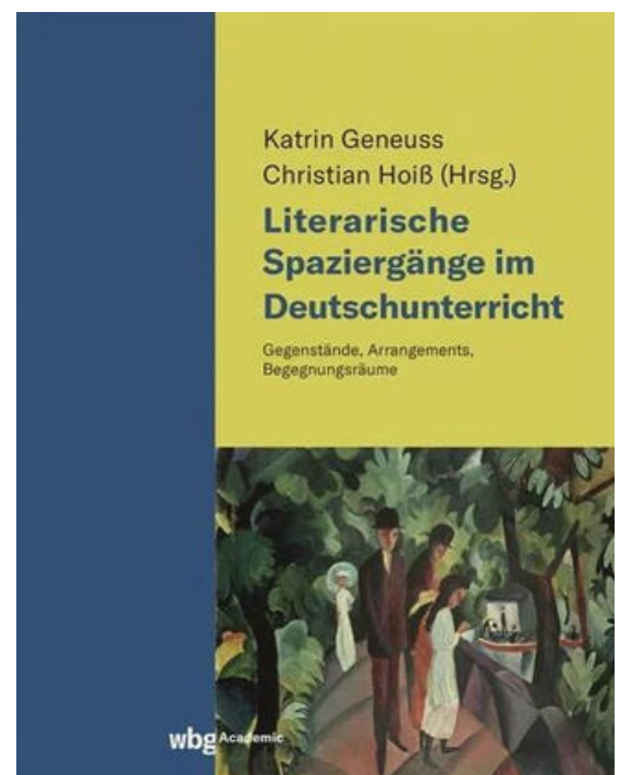
“Literarische Spaziergänge im Deutschunterricht” ©wbg Academic

Die in diesem Band zusammengetragenen Beispiele zeigen, dass die Spaziergänge sowohl in der schulischen wie in der außerschulischen Bildung für verschiedene Zielgruppen einsetzbar sind. Die Lektüre dieses frisch erschienenen Bandes bietet einen Blick auf das Spektrum der Möglichkeiten.