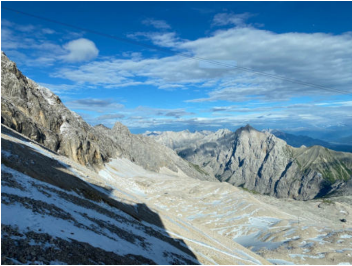
Blick ins Reintal

Exkursionen sind eine vortreffliche Möglichkeit, erfahrungsbasiert zu lernen und neue Inhalte an unbekannte Umgebungen zu knüpfen. Im el mundo Zertifikatsprogramm machen wir uns noch dieses Jahr auf den Weg auf die Zugspitze , wo wir eine Zukunftswerkstatt abhalten werden, um Leitbilder BNE-tauglicher Schule der Zukunft zu erarbeiten.