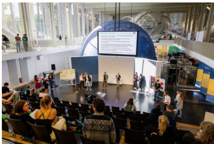
CDR Konferenz

Die bundesweite Bildungskonferenz zum Thema CO 2 -Entnahme aus der Atmosphäre brachte Wissenschaftler:innen und Didaktiker:innen zusammen, um gemeinsam die Klimabildung in den Schulen zu fokussieren. Auf der Konferenz plädierten Schüler:innenvertreterinnen des Schülerstadtrats München dafür, Themen der Nachhaltigkeit bereits ab den frühen Grundschuljahren zu behandeln und nicht erst in der Oberstufe. Studierende des el mundo Programms hoben die Notwendigkeit gemeinsamen Handelns hervor und bezogen das Publikum in dringliche Fragestellungen ein, wie z.B. „Wie kann man komplexe Themen der Nachhaltigkeit didaktisch reduzieren?“ Die Materialien zu CDR-Methoden sowie der Referent:innen finden Sie hier .