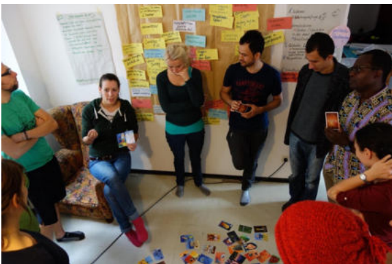
Zukunftswerkstatt mit Commitler:innen

Commit lädt Aktive, Mitglieder, Netzwerkpartner:innen und Interessierte, die sich einbringen möchten, gemeinsam Ziele und Projektideen für das Jahr 2024 zu erarbeiten zur Zukunftswerkstatt ein. Anschließend gibt es ein Neujahrsfest.