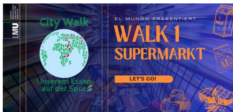
Logo City Walk 1

Die entstandenen Fortbildungsmodule werden nach mehreren Evaluationsrunden auf verschiedenen Portalen für interessierte Lehrpersonen bereitgestellt. Wir halten Sie auf dem Laufenden!