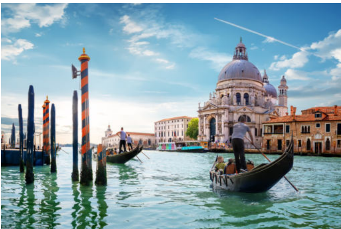
Grand Canal Venice

Des Weiteren fahren wir nach Venedig , um die Architekturbiennale zu erkunden, die unter dem Motto „The Laboratory of the Future“ steht. Was das mit Schulunterricht aller Fächer und Jahrgangsstufen zu tun hat? Die el mundo Studierenden stellen sich der Herausforderung zu erarbeiten, wie sich das große Thema „Leben, Wohnen, Bauen“ in ihren jeweiligen Fachunterricht integrieren lässt.