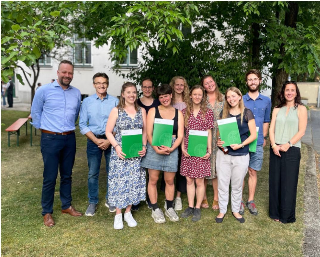
Zweiter Abschlussjahrgang des el mundo - Zertifikatsstudiums

Am 29.06.2023 durften wir mit einer Abschlussfeier den zweiten el mundo - Jahrgang, der im Wintersemester 2020/21 das Zertifikatsstudium aufgenommen hatte und dieses im Frühjahr 2023 erfolgreich abschlossen hat, verabschieden. Wir wünschen euch viel Erfolg auf eurem weiteren Weg und danken euch für die gemeinsame Zeit!