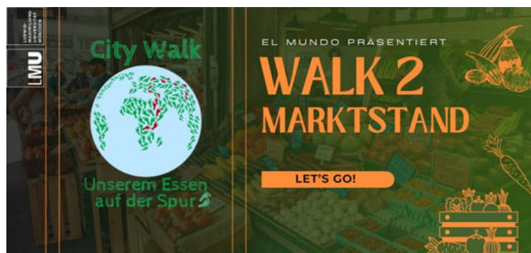
Logo City Walk 2