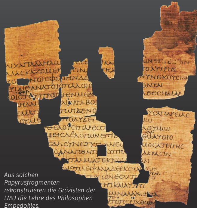
Aus solchen Papyrusfragmenten rekonstruieren die Gräzisten der LMU die Lehre des Philosophen Empedokles.

Gemeinsam fragen die Disziplinen nach dem Selbstverständnis antiker Menschen und Gesellschaften, wie es sich in Texten und Artefakten realisiert. Sie erforschen den Zusammenhalt menschlicher Gemeinschaft, die Gestaltung von Welt und Umwelt, die Herausbildung von Fremd- und Eigenbild. Sie beschäftigen sich mit sozialen, politischen und religiösen Wandlungsprozessen und blicken aus der reichen Überlieferung in die Köpfe antiker Menschen.