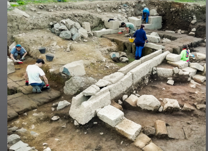
Studierende aus München graben im Heiligen Hain der Diana in Nemi nahe Rom.

Nach dem BA können Sie ein Masterstudium im In- und Ausland und eine Promotion anschließen, oder direkt ins Berufsleben einsteigen.